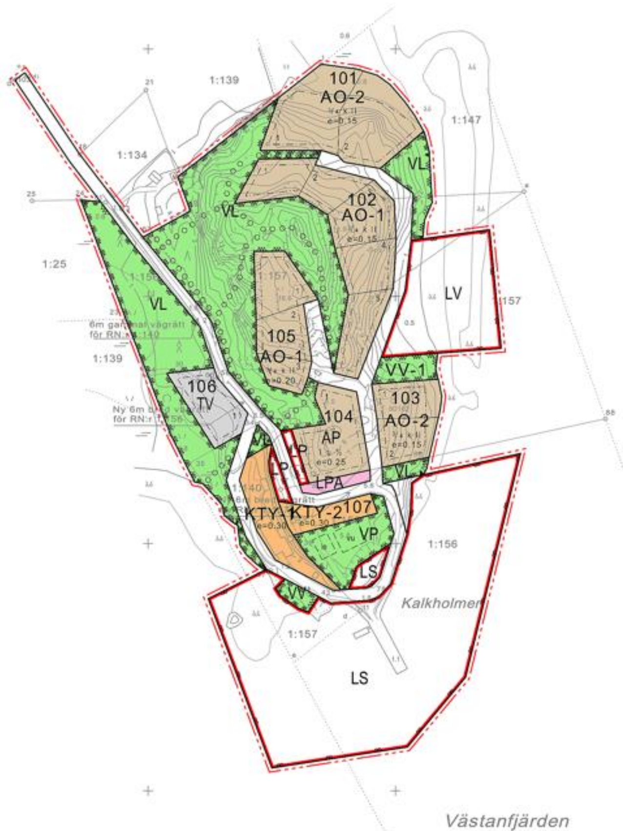
Kalkholmens planutkast, Kimitoöns kommun

Kalkholmens utvecklingsbehov betraktas nedan med hänsyn till Åbolands Sjökvarter, gästhamnen och Caravan parkering.