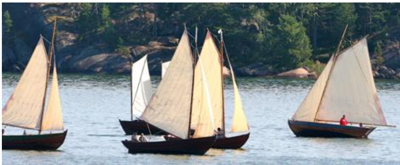
Allmogebåtar i Nagu, foto ©Aaro Söderlund 2012

FÖRSLAG: Västanfjärd kunde kalla de traditionella träbåtarna/allmogebåtarna till ett stort sjömöte.