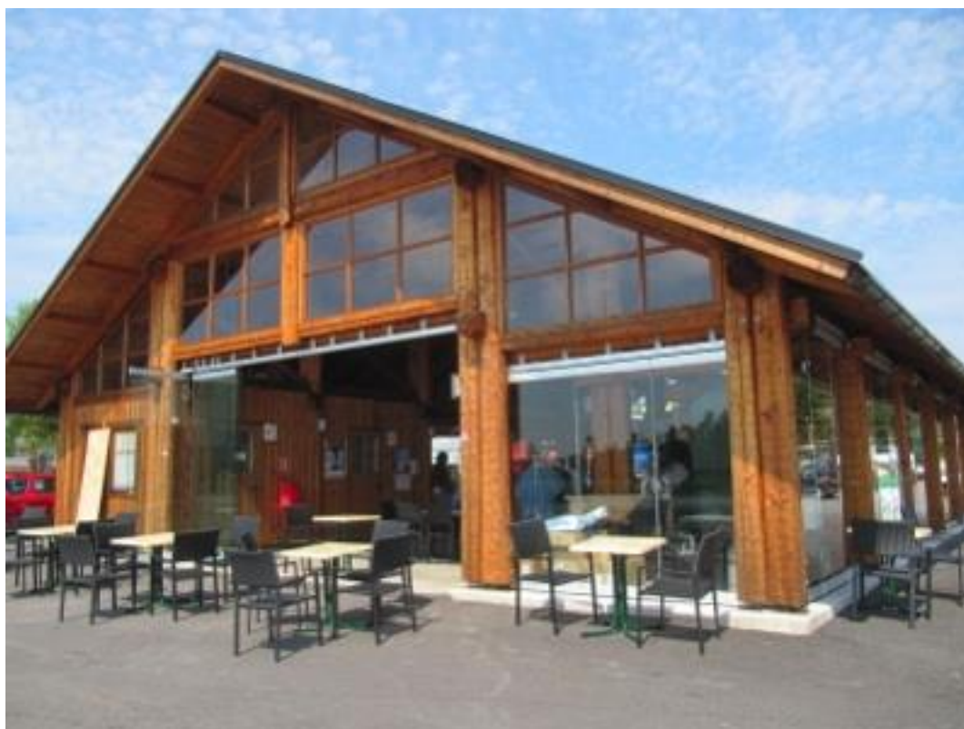
Nagu Torghall 'Kajutan'