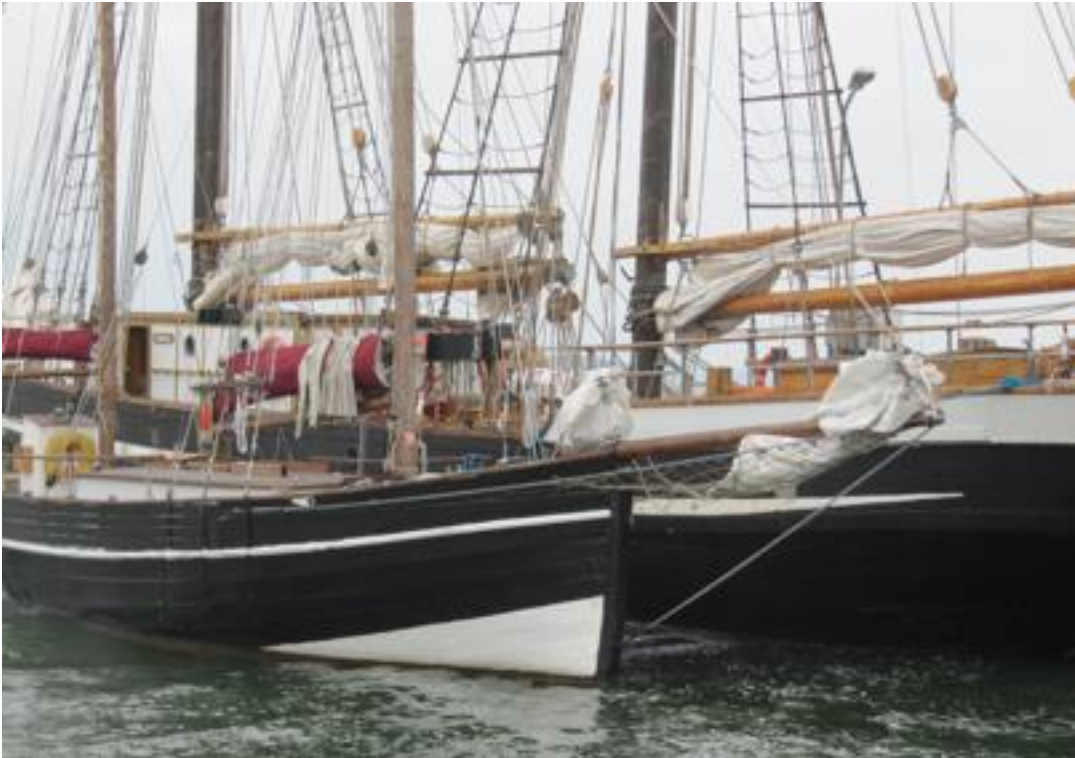
Skutar i Nagu

Huvudleden i Västanfjärd har ett djup -2,4 m som möjliggör besök av 14 medlemskepp av Skutförening Kustkultur i Finland rf. 5