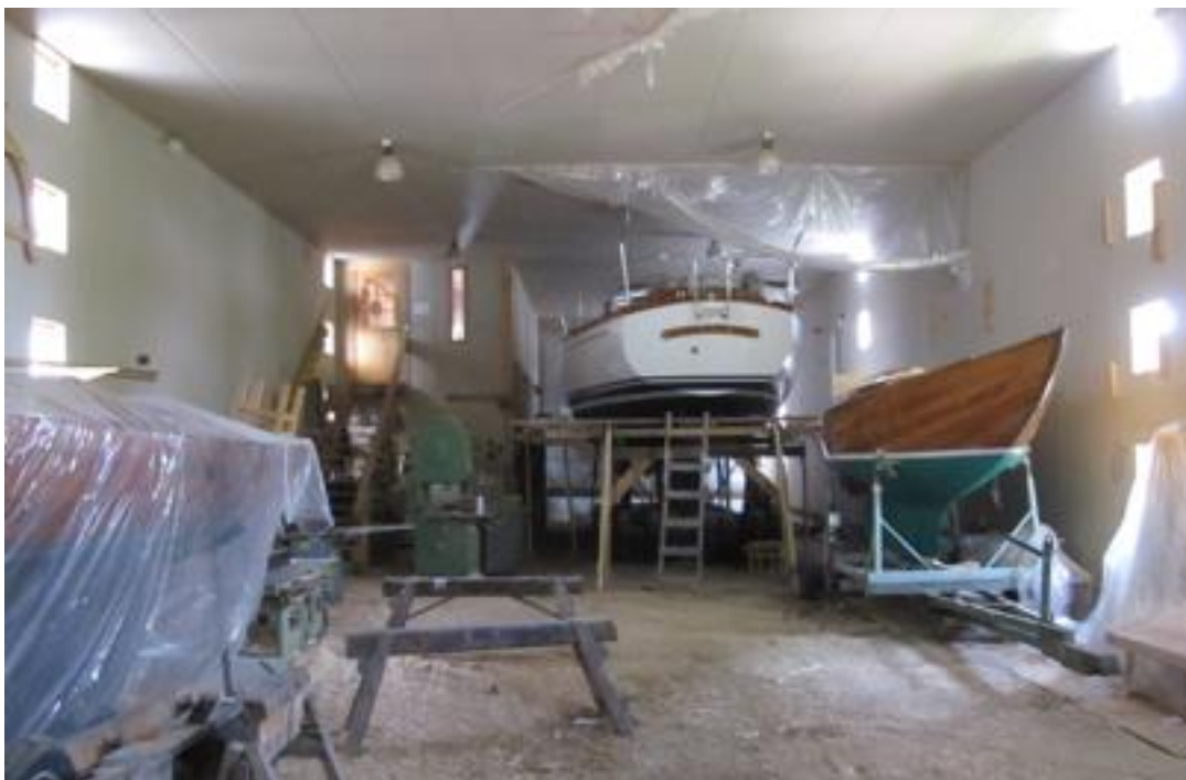
Eugeniavarvet, foto ©Aaro Söderlund 2012

Även om det fanns före, i och/eller bakom Lammala hur många som helst intressepunkter, behövs nog ännu ett sådant spjutspetsmål, som överskrider mediatröskeln, och lyfter hela Västanfjärd på en gång till allmän vetskaper. Med det kan andra projekt och aktörer få ny uppmärksamhet och nya kunder.