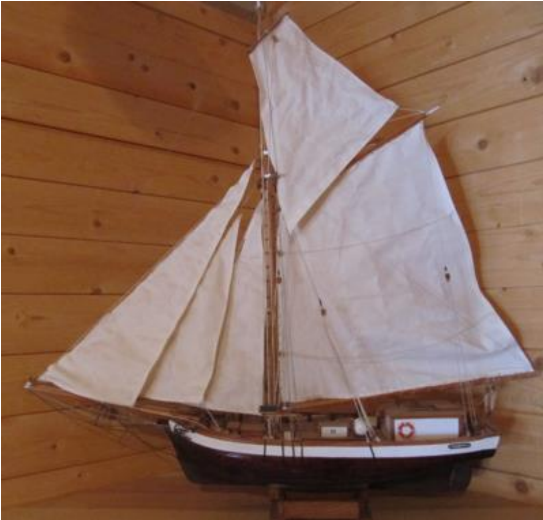
Eugenia-modell på Café Eugenia, foto ©Aaro Söderlund 2012